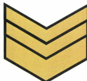
11-й класс (7 год обучения)

Нарукавные знаки различия по классам (годам) обучения в форме угольников золотистого цвета носят на внешней стороне левого рукава парадной, повседневной, полевой и зимней формы одежды обучающихся в кадетском классе на расстоянии от нижней части нарукавного знака принадлежности к кадетским классам 58 школы до верхней части нарукавного знака различия по классам (годам) обучения 10 мм.