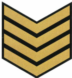
8-й класс (4 год обучения)