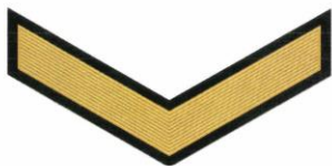
5-й класс (1 год обучения)