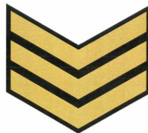
7-й класс (3 год обучения)