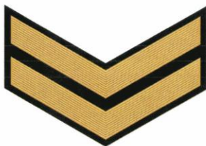
6-й класс (2 год обучения)