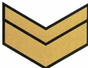
10-й класс (6 год обучения)