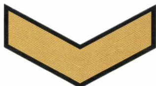
9-й класс (5 год обучения)